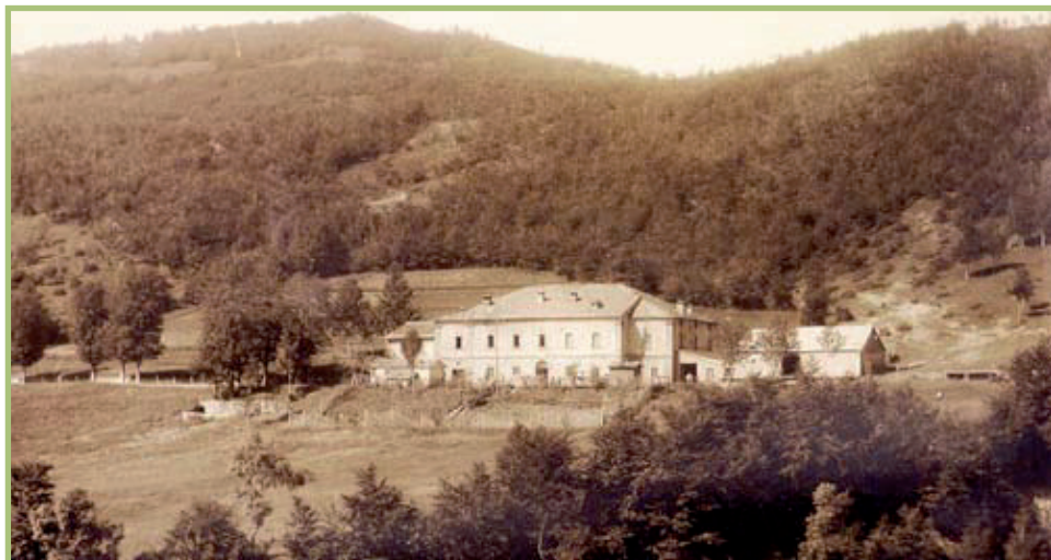
Foto del 1921 Il Casone con il tetto coperto a piastre e di lato il deposito di carbone

Dopo l'ultimo conflitto bellico l'edificio fu modernizzato a struttura ricettiva, mantenendo inalterate quelle caratteristiche architettoniche che rendono tutt'oggi l'edificio ospitale.